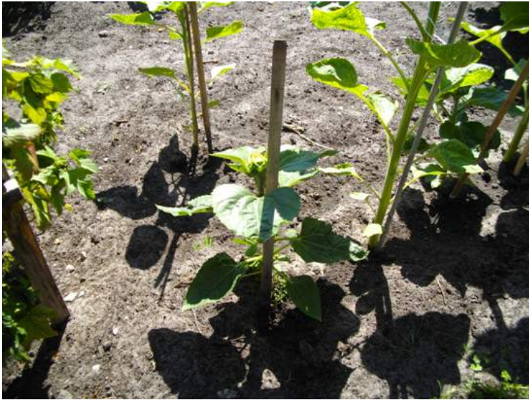
Ise tehtud, hästi tehtud!