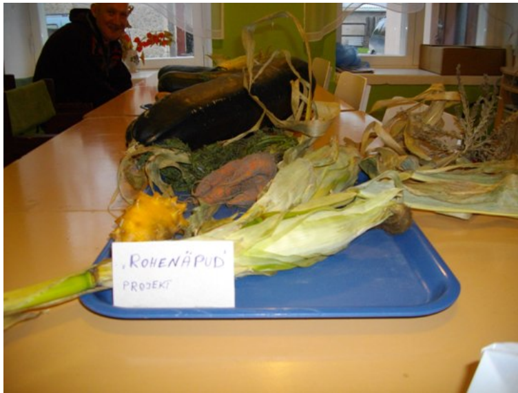
Teel purki - talvehoidiste valmistamine