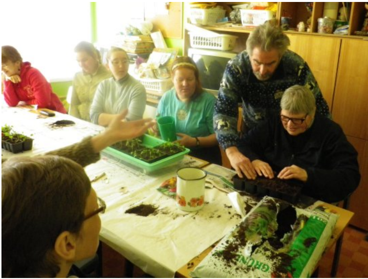
1 kuu hiljem