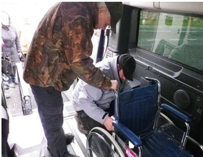
Orissaare ja Valjala vallas