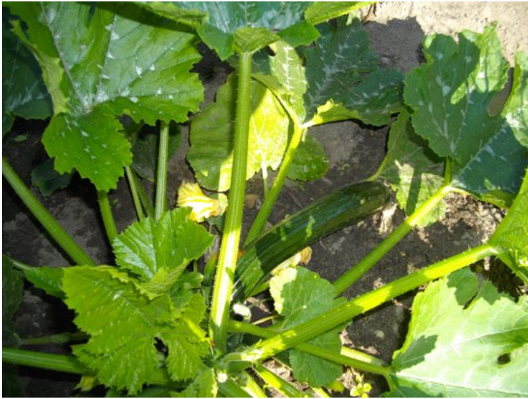
Nagu sõdurid reas sirguvad päevalilled