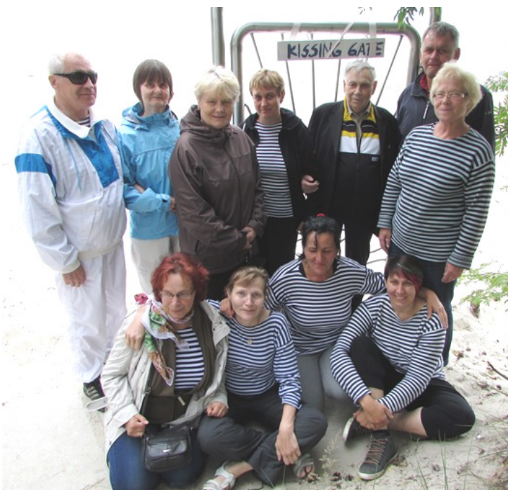
Saaremaa Pimedate Ühingu seltskond, vabatahtlikud abilised ja bussijuht 7. juulil Valgeranna liival

Maailm me ümber on meri - vaata ise, kui näha sul soov! Näe, taevas, see on nagu meri ja pilved kui vahused vood.