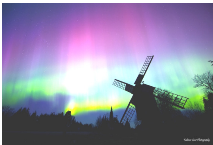
Muhu saarel Nautses nähtud virmalised