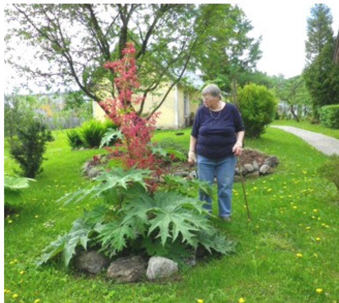
Kämmalrabarber – võimas tunnistus inimese ja looduse koostööst