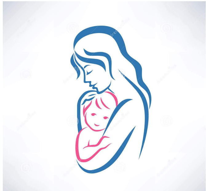
Mai teine pühapäev on emadepäev